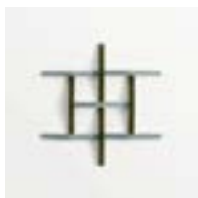
Adagio Grigio + Verde