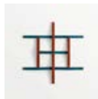
Adagio Rosso + Blu