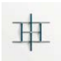
Adagio Grigio + Blu