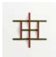
Adagio Rosso + Verde