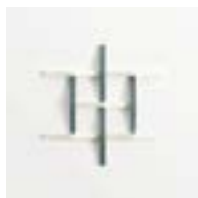
Adagio Grigio + Bianco